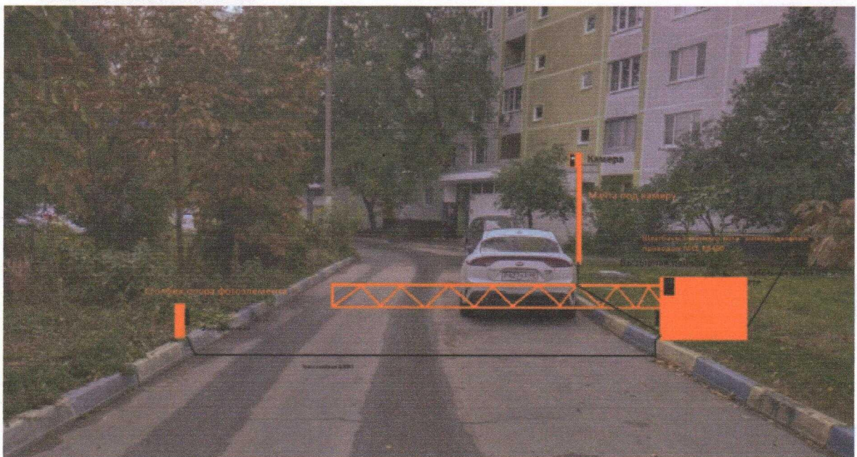
Рис. 1 Схема размещения шлагбаума